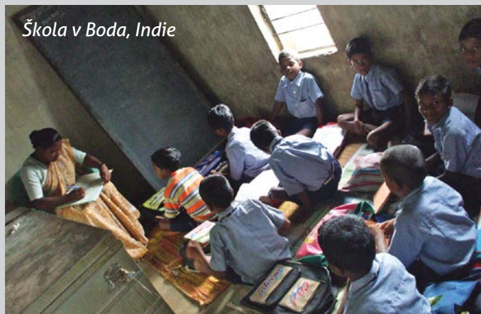
Škola v Boda, Indie

V srpnu tohoto roku odjeli žáci a učitelé našeho gymnázia z Burlo do naší misie v Indii. Přitom navštívili dvě misie, v nichž obláti vedou školy. Setkali se bez zábrán s dětmi, mladými a dospělými, kteří zde žijí. Nadšení bylo veliké a studenti o své zkušenosti mohli plni radosti vyprávět svým spolužákům. Sice se zde setkaly dvě odlišné kultury, ale to nebylo žádnou překážkou k tomu, aby se konalo