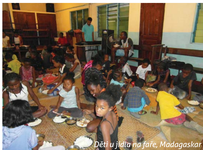
Děti u jídla na faře, Madagaskar

Naši misijní práci na vesnicích a v buši si neumíme představit bez našich pomocníků v misii. My misionáři nemůžeme vždy dojet za společenstvím, které by nás potřebovalo, protože nás není tolik a infrastruktura v zemi není dobrá. Nutně potřebujeme laiky, kteří nám jsou v případě potřeby ochotní pomoci. Musí být vzdělaní a stále vzdělávání, protože na nich leží zodpovědnost pomoci lidem v jejich denních těžkostech, jako jsou hygienické standardy a základní lékařské poradenství. Každoročně tedy zveme všechny katechetky a katechety i ty, kdo pomáhají svým komunitám, k účasti na dalším vzdělávání. Společně s lidmi z oboru medicíny a pastorační jim poskytujeme dvoutýdenní školení. Účast na kurzu je pro ně zdarma, protože příjmy některých jsou mizivé, takže si mohou dovolit jen velmi malý příspěvek. A tak vás prosíme o podporu,