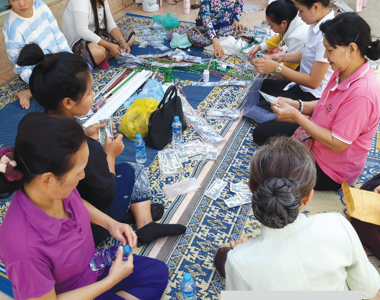
Katolická komunita a poslední přípravy na blahořečení