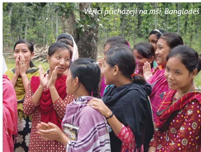
Věřící přicházejí na mši, Bangladéš

a znovu jste nám poslali kontejner s humanitární pomocí. Lidé jsou popravdě stále ještě na vaší pomoci závislí. Vánoce tak mohou být díky tomu pro mnoho rodin znovu svátkem radosti. Upřímně děkujeme.